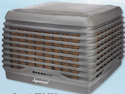
Breezair TBS 580