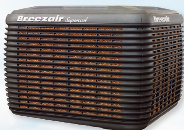
Breezair EXS 220

La gama Supercool de Breezair proporciona un increíble aumento del 15 % (EXS 220) y del 24 % (TBS 580) de la capacidad de refrigeración respecto a la gama estándar.